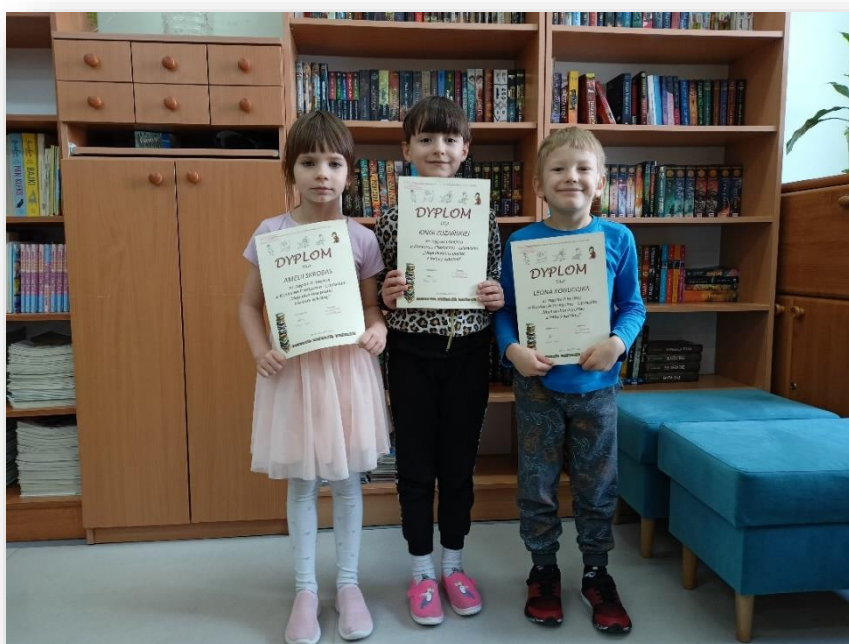
Nagrodzeni uczniowie z kl. 1b