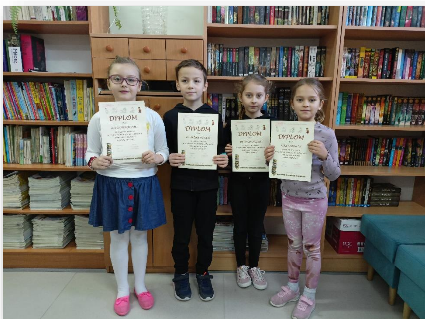
Nagrodzeni uczniowie z kl. 1a