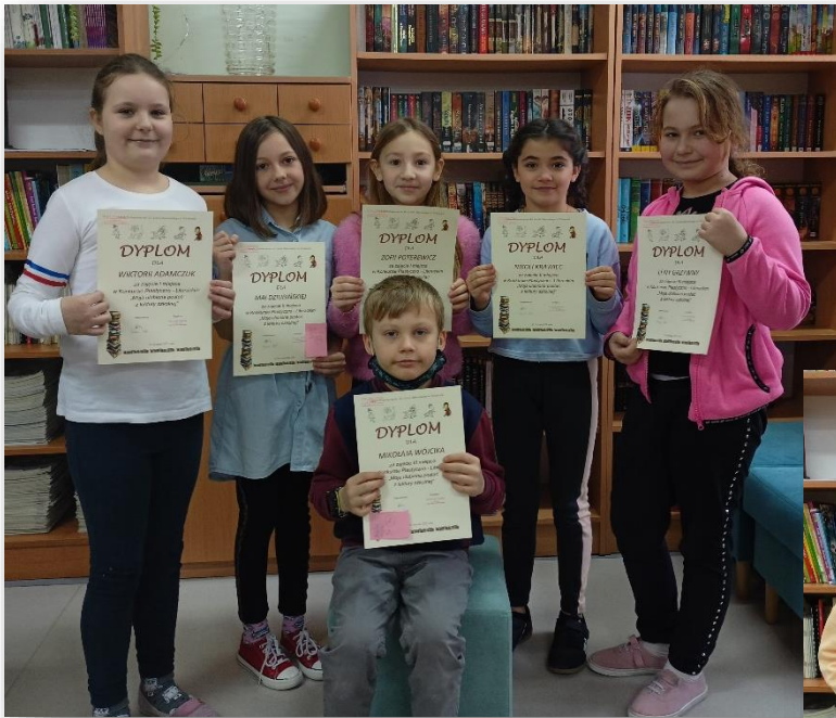
Nagrodzeni uczniowie z klas 2a i 2b