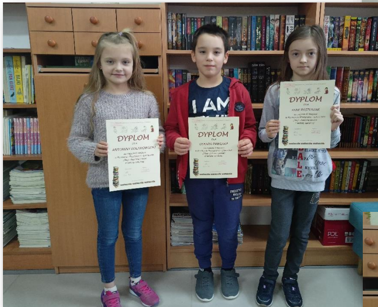
Nagrodzeni uczniowie z klas 3b i 3c